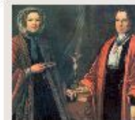
Giulia e Tancredi